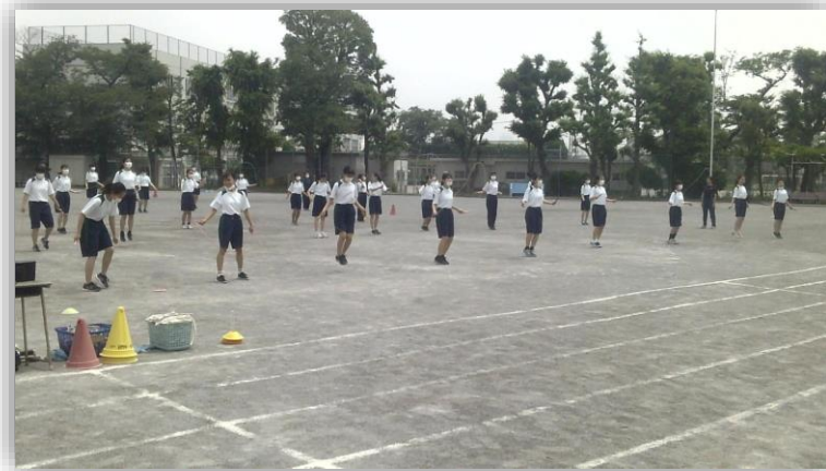
十分距離をとっての保健体育科の授業