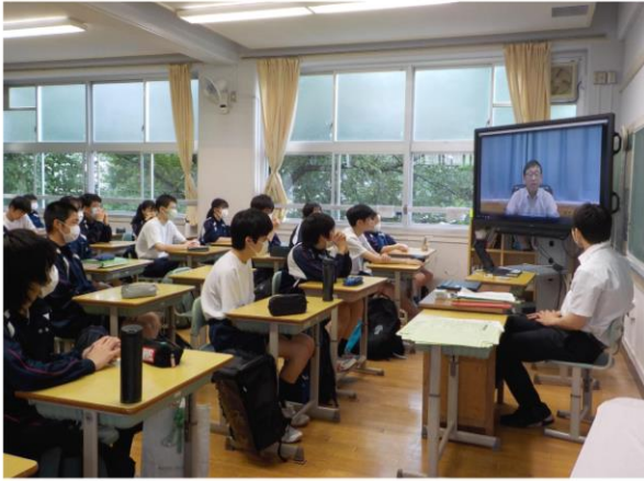
リモートによる全校朝礼(校長講話)