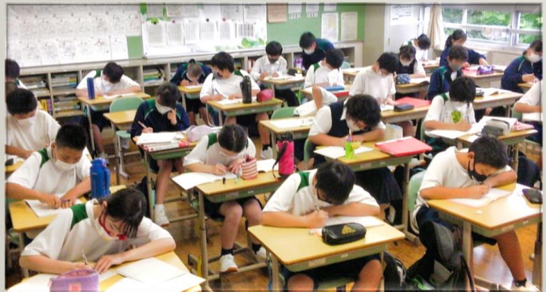
定期考査前の補充教室

休校開けの生徒たちは、戸惑いがちに学校に戻ってきました。大きな集団での活動については制約があるため、リモートによる全校朝礼が行われています。保健体育科では十分な距離をおきながら授業が行われています。一方で個々の生徒が取り組む場面では、集中して課題に取り組む姿がありました。